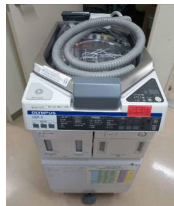
内視鏡洗浄消毒装置