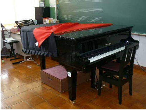
グランドピアノ・椅子