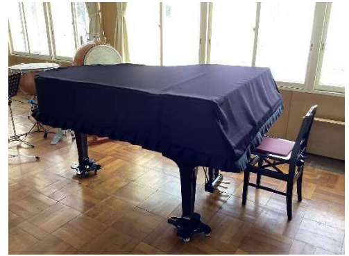
グランドピアノ・椅子