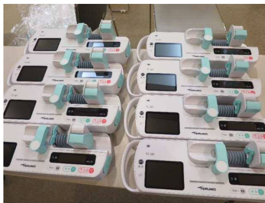
シリンジポンプ 38 型