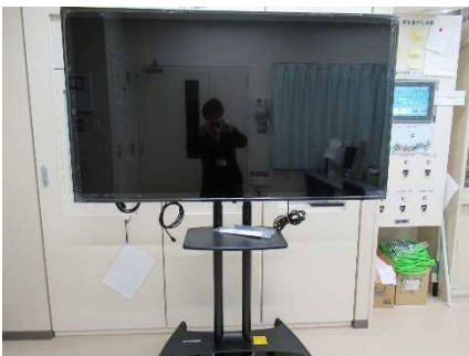
液晶ディスプレイ・スタンド