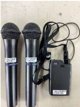
ワイヤレスマイク